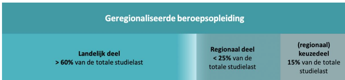
Figuur 1: Opbouw geregionaliseerde beroepsopleiding

Een geregionaliseerde beroepsopleiding is gericht op het behalen van een geregionaliseerde kwalificatie - bestaande uit een landelijk deel en een regionaal deel - en één of meer bestaande of regionale keuzedelen. De geregionaliseerde beroepsopleiding leidt tot een volwaardig diploma. De opleiding wordt gegeven in de beroepsopleidende leerweg (BOL) of beroepsbegeleidende leerweg (BBL). De kenmerken van de verschillende onderdelen van de opleiding worden in het volgende hoofdstuk verder toegelicht.